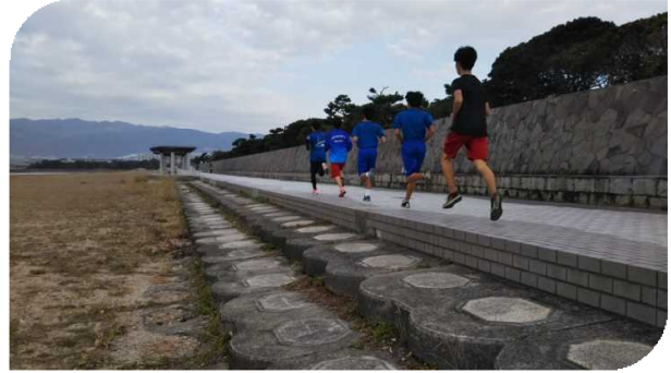
直線1kmある景色も最高のロード！